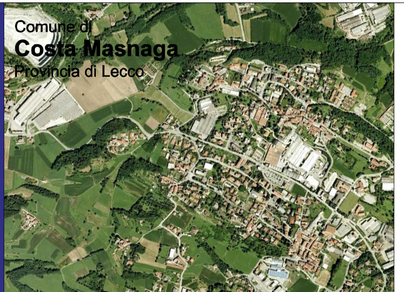
tavola 1c scala 1:10.000

Comune di Costa Masnaga Provincia di Lecco